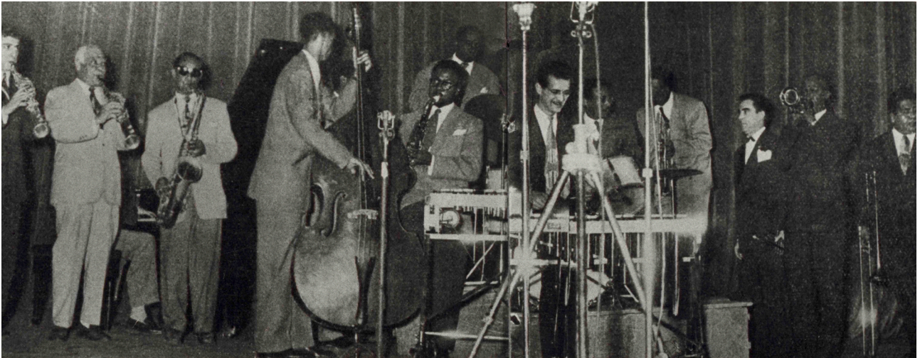
Toots met de Charlie Parker All Stars, Salle Pleyel, Parijs, 1949

Het eerste deel van de expo vertelt wie Toots Thielemans is. Zijn leven is een aaneenschakeling van boeiende ontmoetingen en ontdekkingen die vaak bepalend blijken voor zijn verdere carrière. Nieuwe mensen, nieuwe instrumenten, nieuwe muziekstijlen. Toots krijgt de jazzmicrobe te pakken door naar de swingende muziek van Louis Armstrong en de manouche van Django Reinhardt te luisteren. Niet veel later komen daar de avant-garde beboppers bij met Charlie Parker als grote voorbeeld. Zijn ontdekking van de jazzscène in Amerika is de start van een bloeiende carrière. Hij zal een onuitwisbare indruk nalaten, niet alleen in de jazzwereld, maar ook ver daarbuiten.