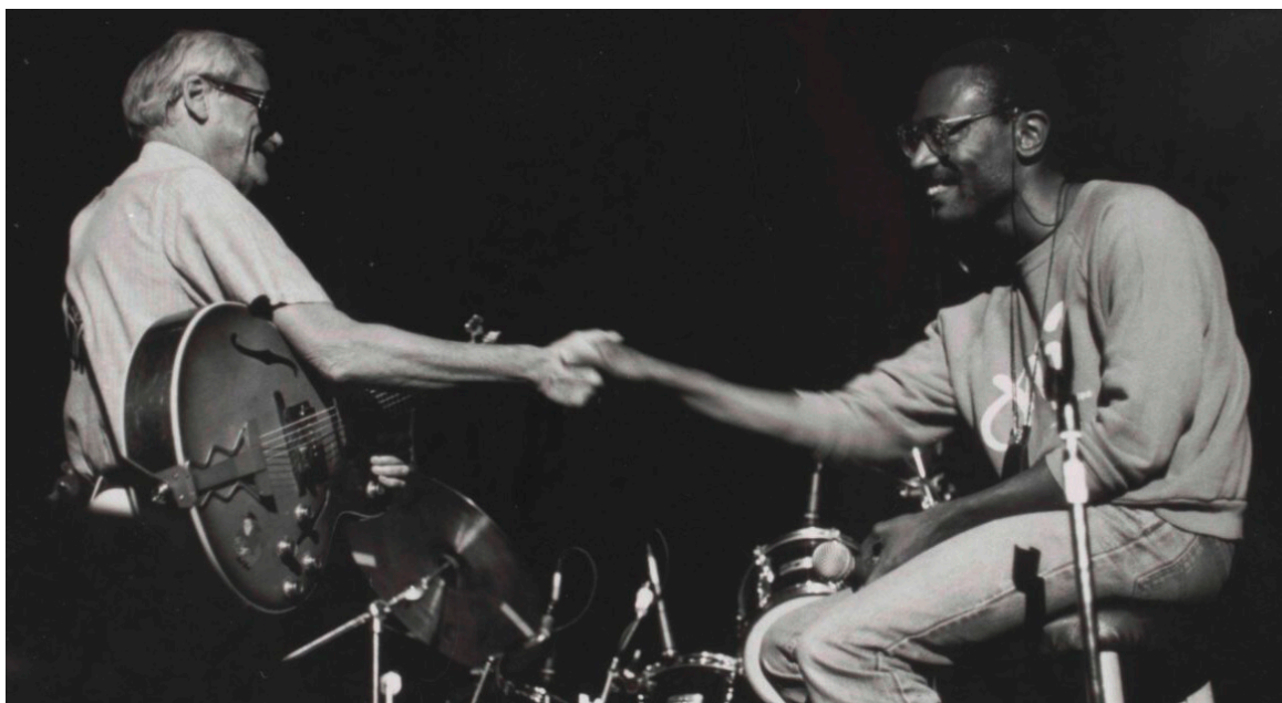
Toots en Bobby McFerrin

Tijdens deze lezing stelt Hugues Warin een analyse voor van de verbanden tussen de esthetische keuzes van Toots en de sociaal-politieke contexten die hij tijdens zijn leven heeft gekend. Deze lezing maakt deel uit van een nocturne, u kunt de tentoonstelling dus bezoeken tot 22.00 uur.