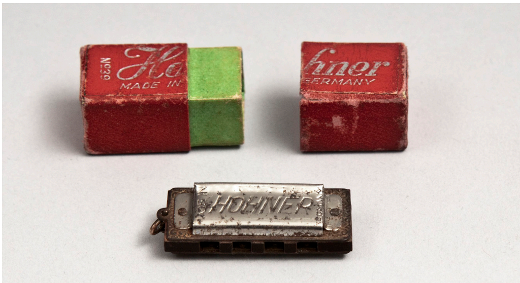
Harmonica Little Lady

Géry Dumoulin neemt u mee voor een ontdekkingsstocht in de wereld van de harmonica en deze familie van instrumenten: instrumenten met vrij trillend riet (accordeon, melodica, harmonium enzovoort). Deze familie van instrumenten zal binnenkort geen geheimen meer voor u hebben. Deze lezing maakt deel uit van een nocturne, u kunt de tentoonstelling dus bezoeken tot 22.00 uur.