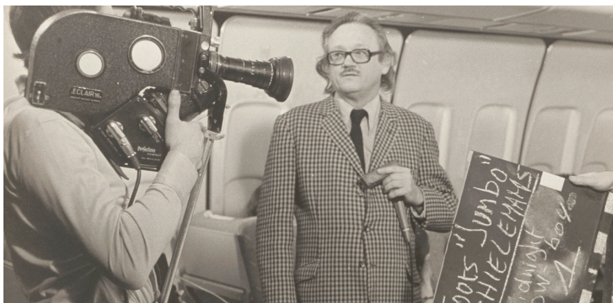
Toots voor een promofilmpje voor 'Midnight Cowboy'

Ontdek deze componenten in de werelden van Toots: zijn eigen composities, de jazz-stijlen die hij speelt, de Latijns-Amerikaanse muziek, de film- en reclamewereld en de sociale dimensie binnen de jazz.